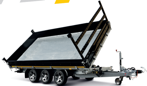
*Abbildung enthält Sonderausstattung